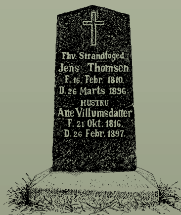
Tegning: Poul Andersen