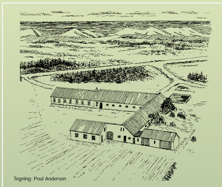
Tegning: Poul Andersen