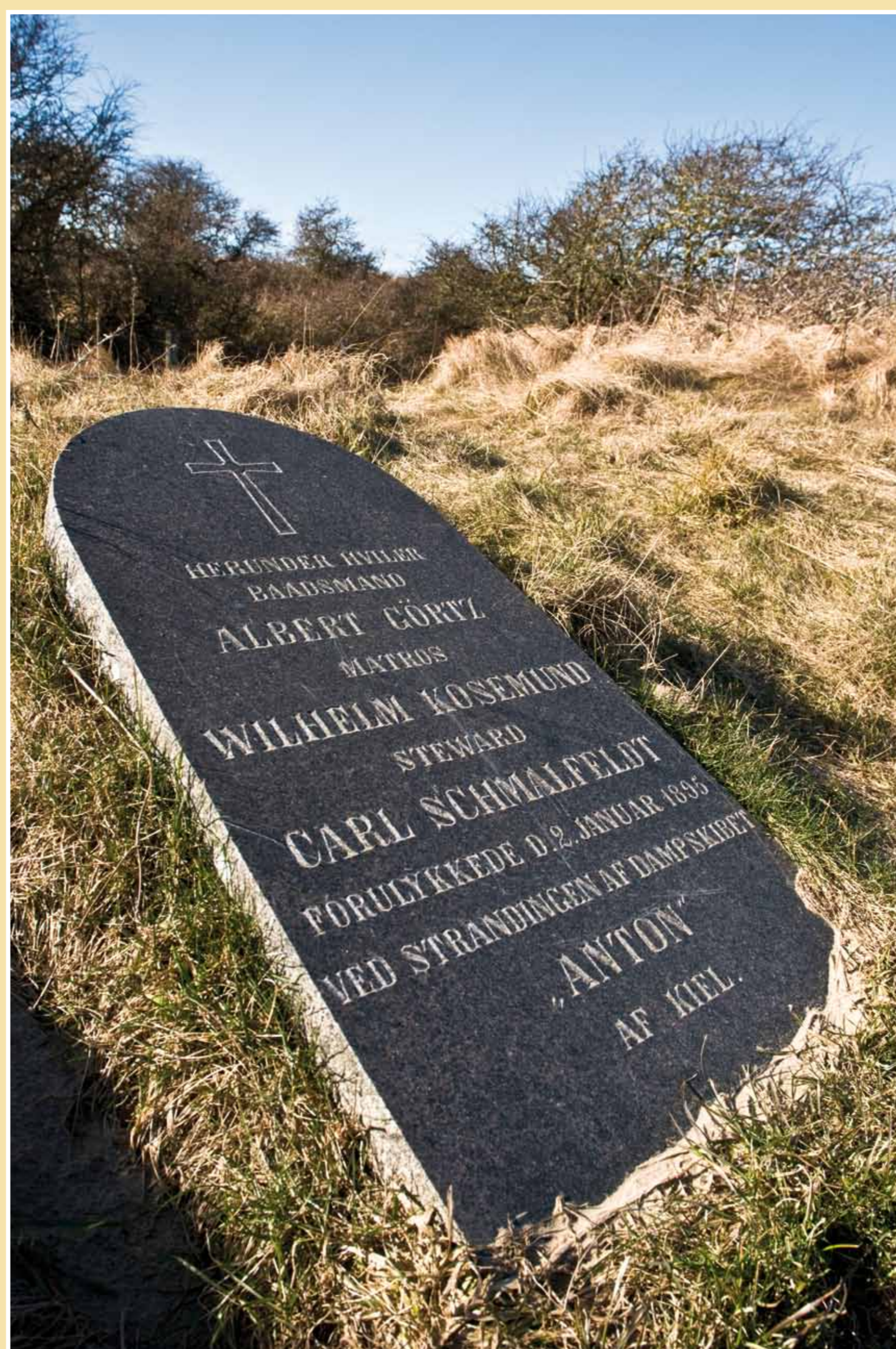
Gravsten for tre af de fire druknede. Den fjerde fik sin kiste bragt hjem til Tyskland. Gravstenen kan ses på Rubjerg gamle kirkegård.