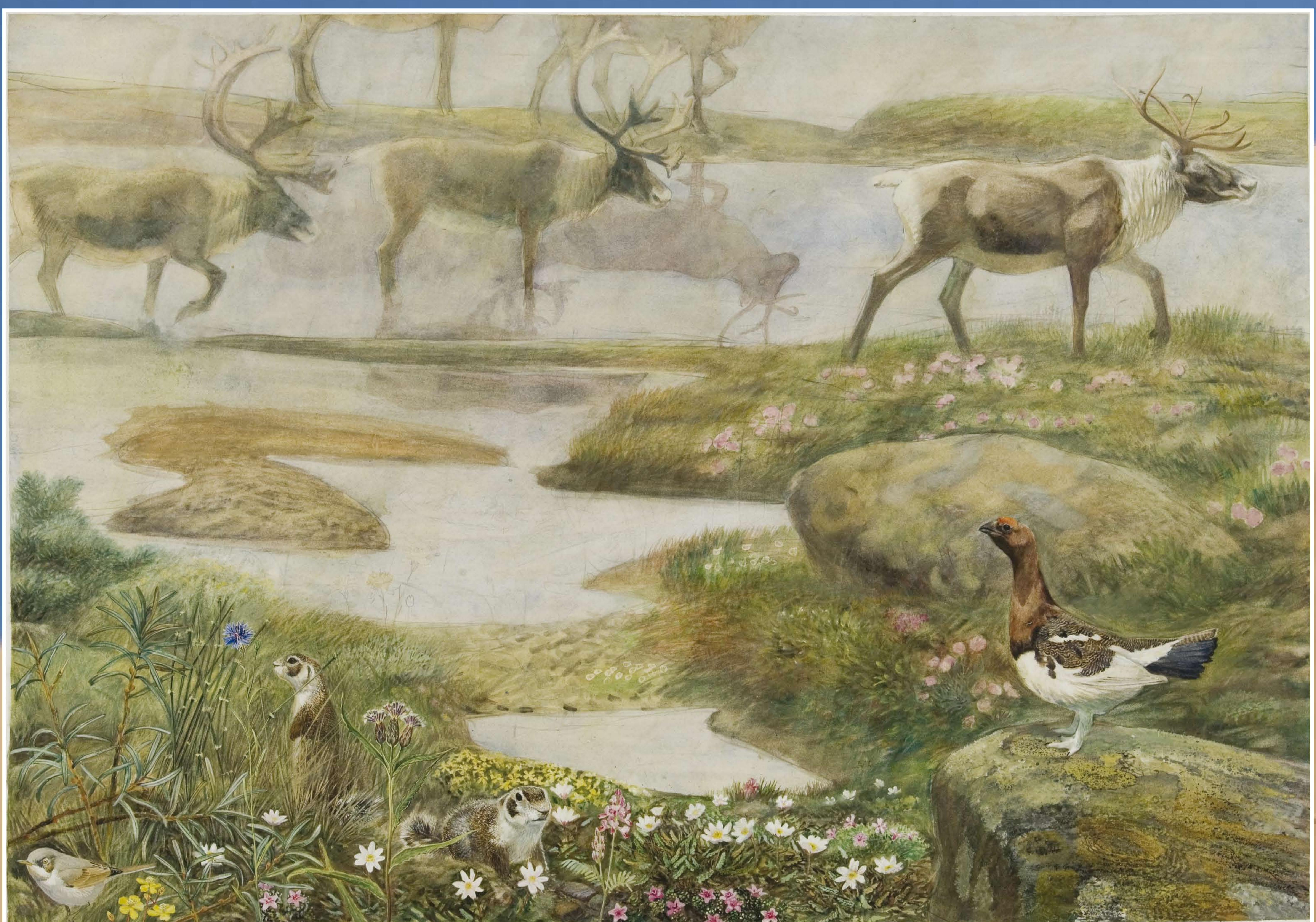
Billede baseret på fundene ved Nr. Lyngby. Rensdyr bagerst og ørkensanger, sidsel og dalrype forrest.